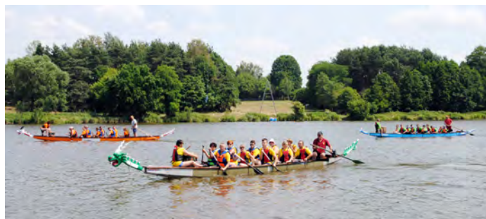
Do rywalizacji stanęło 11 załóg

Kolejny już raz dyscyplina wodna, której tradycje sięgają aż do Chin miała miejsce na wodach Stawu Górnego. W sobotę 25 czerwca dragon boats, czyli smocze łodzie opanowały pionkowski akwen wodny. Do wodnej rywalizacji sportowej zgłoszono jedenaście załóg.