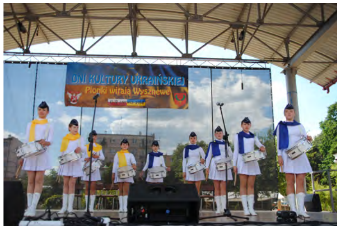
W ukraińskich rytmach