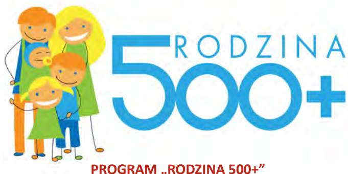
PROGRAM „RODZINA 500+”

W piątek 1 kwietnia 2016 r. oficjalnie wystartował w Polsce program „Rodzina 500 plus”. W Pionkach wniosek o świadczenie wychowawcze można złożyć w Miejskim Ośrodku Pomocy Społecznej ul. Leśna 5 w Dziale Świadczeń Rodzinnych (parter pok. nr 2, 3 i 4).