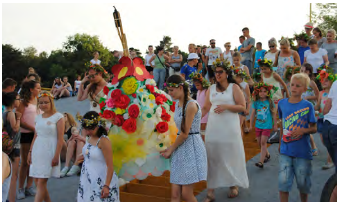
Panienki tradycyjnie wity wianki i puszczały je do wody