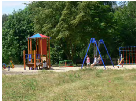
Plac zabaw - zbudowaliśmy plac zabaw przy ul. Kruczej 9 wartość inwestycji: 27.100,00 zł