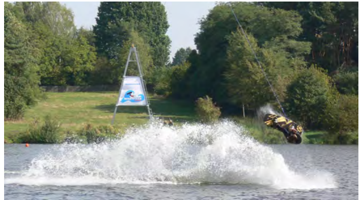
Wyciąg do wake'a przyciąga miłośników sportów wodnych z całej okolicy