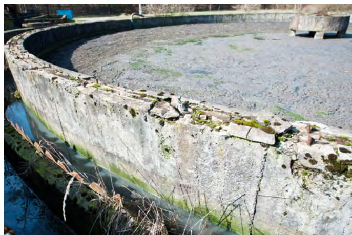
Oczyszczalnia przez lata nie była modernizowana

Burmistrz zorganizował dla radnych wizytę studyjną