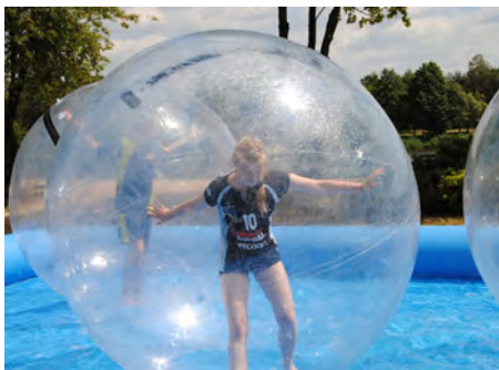
Kule wodne z basenem - kupiliśmy zestaw atrakcji nad Staw Górnym, przeznaczony dla dzieci, młodzieży i dorosłych wartość inwestycji: 8.300,00 zł