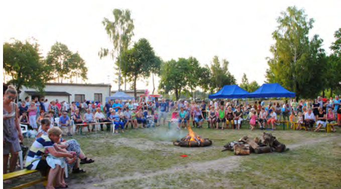
W tym roku również nie zabrakło chętnych do skoków przez ognisko

Pionkowskie „Sobótki, Janki, Wianki” to szukanie kwiatu paproci, wyplatanie tradycyjnych wianków oraz cieszące się dużą popularnością skoki przez ognisko.