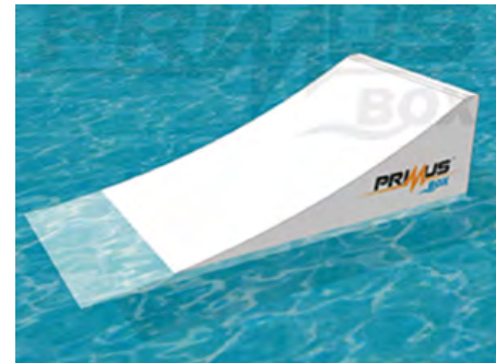
WAKEPARK - kupiliśmy dwie przeszkody wodne do wakeboardu wartość inwestycji: 50.430,00 zł