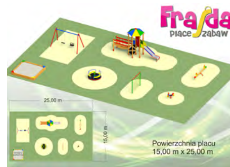
Plac zabaw - rozpoczęliśmy budowę placu zabaw przy ul. Brzozowej wartość inwestycji: 45.000,00 zł