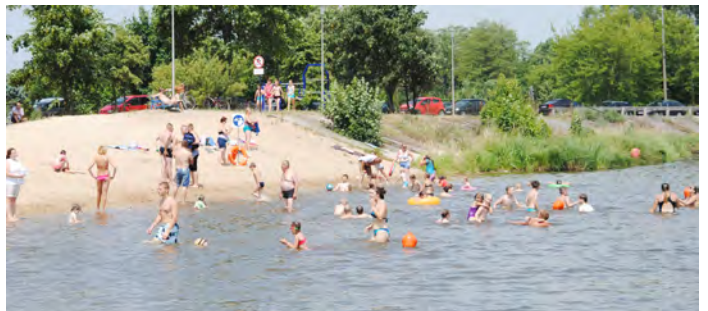
Mieszkańcy Pionek w upalne dni chętnie korzystają z plaży miejskiej

Apelujemy do osób wypoczywających nad Stawem Górnym o wspólną troskę o nasz ośrodek, o niedopuszczanie do niemądrych zachowań i niszczenia urządzeń. Tłuczenie butelek po piwie na terenie ośrodka, wrzucanie butelek i szkła do wody jest niebezpieczne dla innych użytkowników, w tym szczególnie dzieci! Prosimy nie wprowadzać na teren ośrodka zwierząt, które zanieczyszczają plażę, bo tam między innymi w piasku bawią się dzieci. Prosimy w ogóle nie karmić łabędzi, a szczególnie nie wabić tych pięknych ptaków na teren ośrodka, bo zanieczyszczają piasek i tereny wypoczynkowe. Karmienie dzikich zwierząt nie służy ich zdrowiu! Prosimy również wędkarzy o uprawianie wędkarstwa poza terenem ośrodka – pozostawianie na pomostach rozmoczonego chleba, pływających wokół folii po chlebie itp. śmieci nie wystawiają wędkarzom dobrego świadectwa.