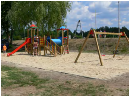
Plac zabaw - zbudowaliśmy plac zabaw nad Stawem Górnym wartość inwestycji: 18.400,00 zł