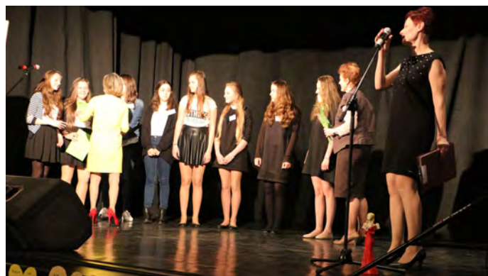
Gala Wolontariatu