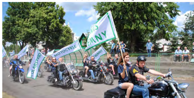
Parada motocyklowa dyscyplin niegdyś uprawianych w KS PROCH