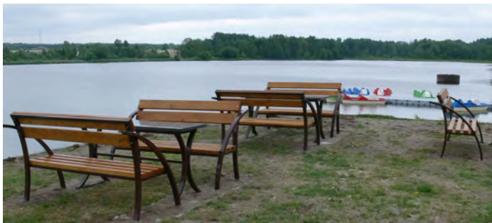
Pojawiły się miejsca do relaksu

Zapraszamy do rodzinnego wypoczynku nad stawem. By ułatwić korzystanie z rekreacji nad Stawem Górnym uruchamiamy możliwość rezerwacji i opłat za narty wodne poprzez portal internetowy www.pionki.wakems.com