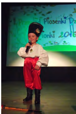
Mali, wielcy artyści podczas przeglądu piosenki dziecięcej