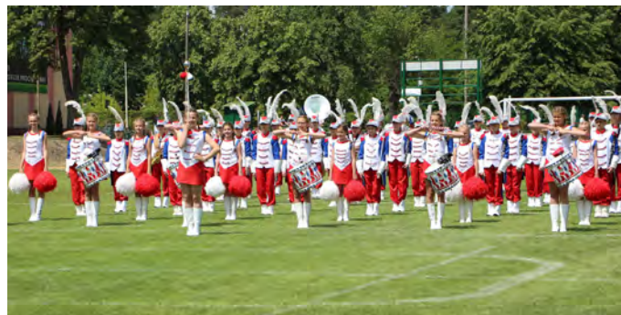
Radomska Młodzieżowa Orkiestra Dęta „GRANDIOSO”