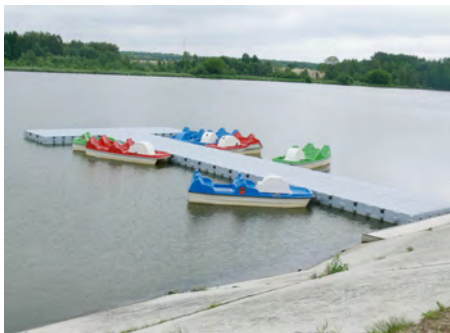
Pomosty - w miejsce starych, zagrażających bezpieczeństwu pomostów kupiliśmy nowe wartość inwestycji: 50.000,00 zł