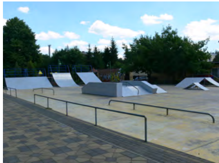
Skate Park - wyremontowaliśmy i pomalowaliśmy elementy na Ogródku Jordanowskim wartość inwestycji: 14.993,70 zł