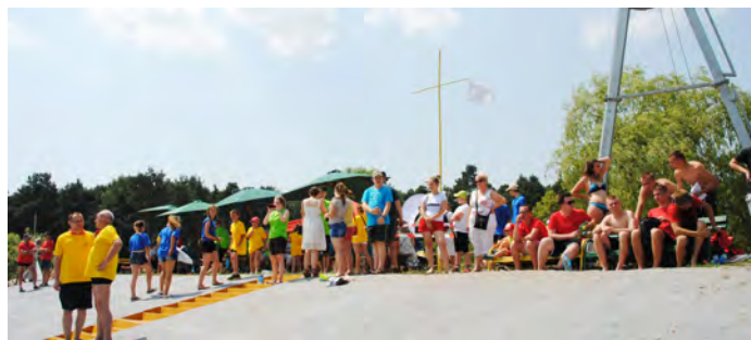
Dzięki dopingującej widowni emocje były jeszcze większe