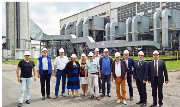
Radni dowiedzieli się, jakie rozwiązania wprowadzić w spółce wodno - kanalizacyjnej w Pionkach

Trzy dni po wizycie studyjnej burmistrz zwołał posiedzenie Rady Nadzorczej i Zarządu PWKC poświęcone problemom spółki i stojącymi przed nią pilnymi zadaniami. Wypracowane przez wakacje rozwiązania zostaną przedstawione w formie projektów rozwiązań i uchwał na najbliższe posiedzenie Rady Miasta.