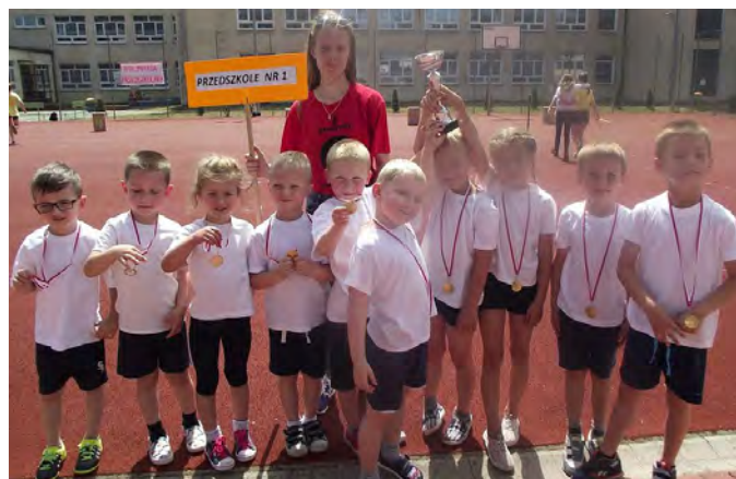
Olimpijczycy z Przedszkola nr 1