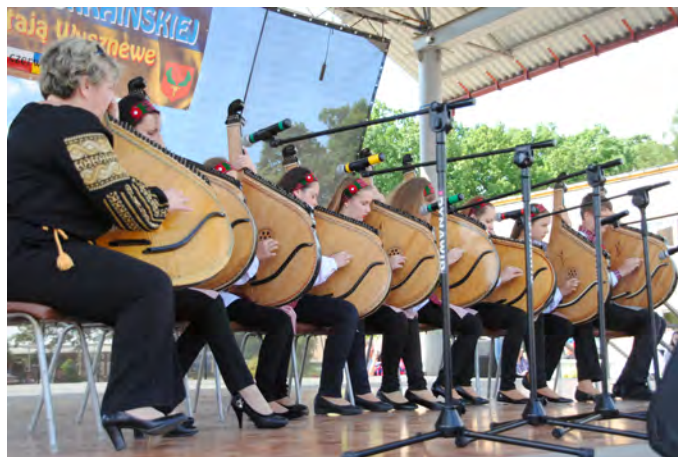
Nowością na pionkowskiej scenie był występ bandurzystek