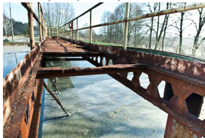
Niezbędna jest jak najszybsza modernizacja

w Tarnowskich Górach. Podczas całodiennej wyprawy radni mieli okazję zapoznać się z tamtejszymi instalacjami wodno-kanalizacyjnymi i ciepłowniczymi, różnorodną formą właścicielską, organizacyjną i prawną ich funkcjonowania, systemami zarządzania i nadzoru, a także spotkać się z burmistrzem i innymi przedstawicielami samorządu tego ponad 60-tysięcznego miasta.