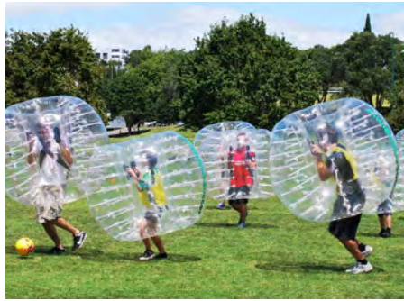
Bubble Football - kupiliśmy zestaw do gry w piłkę w kulach dla dzieci, młodzieży i dorosłych. W sezonie wakacyjnym będzie użytkowany nad Stawem Górnym, zimą w obiektach sportowych wartość inwestycji: 16.000,00 zł