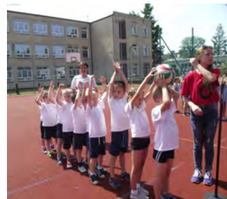
dzieci rywalizacja z zachowaniem zasad fair play