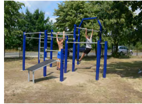
Street Workout nad Stawem Górnym kupiliśmy urządzenia do ćwiczeń na świeżym powietrzu wartość inwestycji: 14.600,00 zł