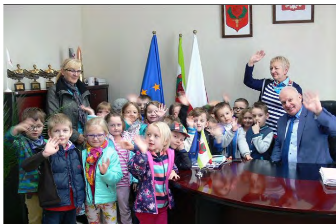
Wizyta w Urzędzie Miasta