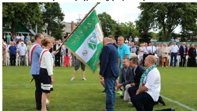
Przekazanie Sztandaru Klubu