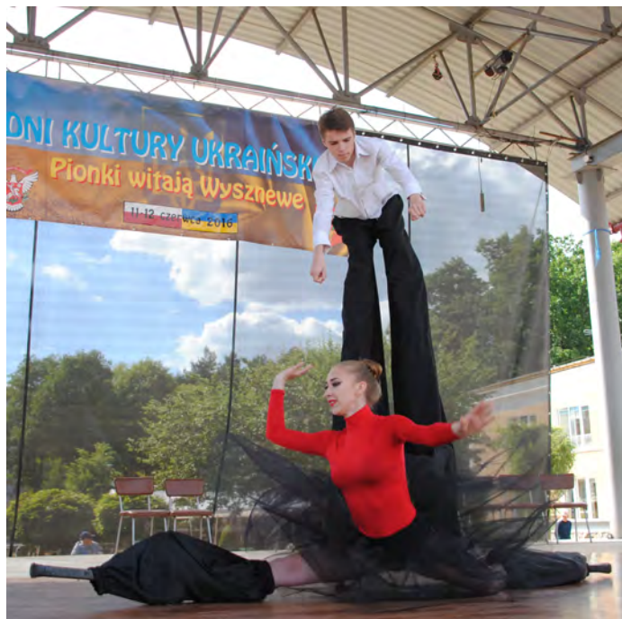
Widowiskowe tango szczudlarzy zachwyliło niemal wszystkich

Pragniemy serdecznie podziękować Ośrodkowi Szkolenia Komendy Wojewódzkiej Państwowej Straży Pożarnej za bezpłatny nocleg dla grupy artystów, a także dyrekcji i pracownikom Publicznej Szkoły Podstawowej nr 5 za przygotowanie posiłków dla występujących.