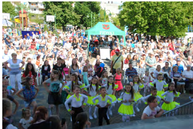
Mieszkańcy Pionek z zainteresowaniem oglądali występy gości