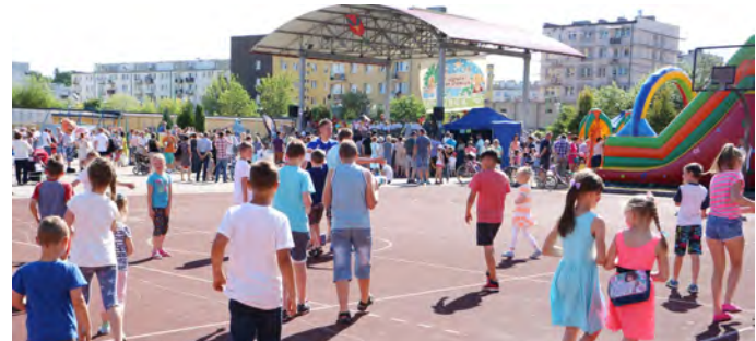
Dzień Dziecka na Ogródku Jordanowskim

WITAMY W PIONKACH MŁODZIEŻ Z NAMIBII, GWINEI RÓWNIKOWEJ, KAZACHSTANU, LITWY, KONGA