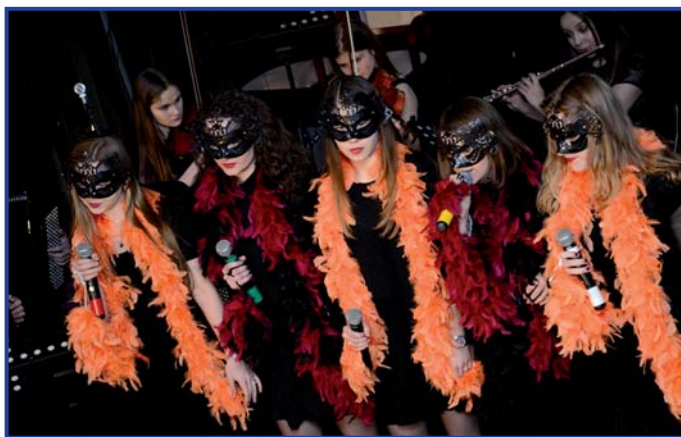
Występy artystów wprawiały w duży zachwyt, foto. CAL.