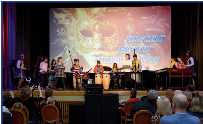
Przepiękny koncert muzyki karnawałowej

Bardzo serdecznie dziękujemy wszystkim ludziom wielkiego serca, którzy włączyli się w akcję.