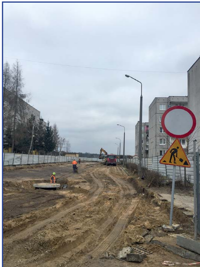
Rozpoczął się remont na odcinku od ul. Adasia Guzala i zostanie przeprowadzony do ul. Garszwo.