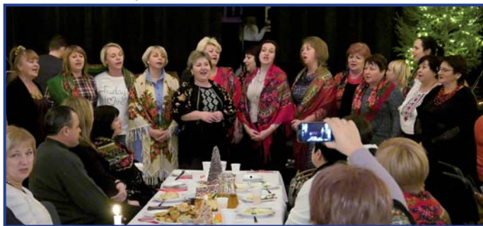
Wspólne kolędowanie, foto. Wojciech Kuchta.

W ramach rewizyty na początku stycznia gościliśmy przedstawicieli oświaty z partnerskiego miasta Wiszniewe. Ukraina stoi przed reformą oświaty, dlatego nauczyciele z dużym zainteresowaniem przyglądali się temu jak funkcjonują placówki edukacyjne w Pionkach. Goście wzięli również udział w Orszaku Trzech Króli, a także w tradycyjnej polskiej wigilii zorganizowanej przez Miejski Ośrodek Kultury.