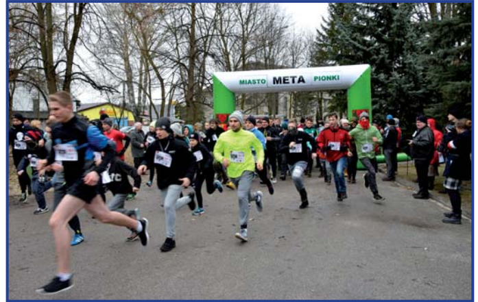
Z roku na rok bieg cieszy się coraz większym zainteresowaniem, foto. Jakub Wojtaszewski, Pionki24.

Imprezami towarzyszącymi były: Turniej gier planszowych, konkurs wiedzy o żołnierzach wyklętych, pokaz filmu pt. „Łupaszka”, prelekcja Profesora Marka Wierzbickiego na temat „Ppłk Zygmunt Szendzielarz ps. Łupaszka i jego Żołnierze”. Zobaczyliśmy również Happening przygotowany przez Stowarzyszenie Patriotyczne Pionki, polegający na odpaleniu dziewięciu rac morskich, jako symbolu „światelka do nieba” upamiętniającego bohaterów podziemia niepodległościowego. Każdy z uczestników otrzymał zestaw startowy, a także grochówkę i gorącą herbatę.