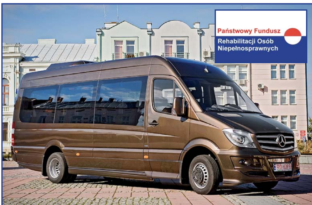
Nowy samochód trafił już do WTZ, foto. Roman Fido.

Nowy autobus zbudowany został na bazie samochodu Mercedes Sprinter 516 CDI Typ 906 BB 50. Zakup pojazdu w przeważającej części sfinansowany został ze środków zewnętrznych pozyskanych przez pionkowski samorząd. Na ten cel miasto Pionki z Państwowego Funduszu Rehabilitacji Osób Niepełnosprawnych otrzymało 207 600,00 zł .