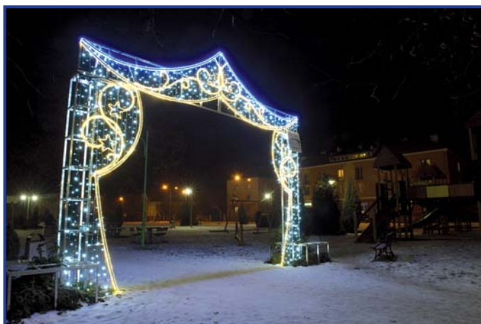
Brama świetlna prowadząca do szopki na Ogródku Jordanowskim