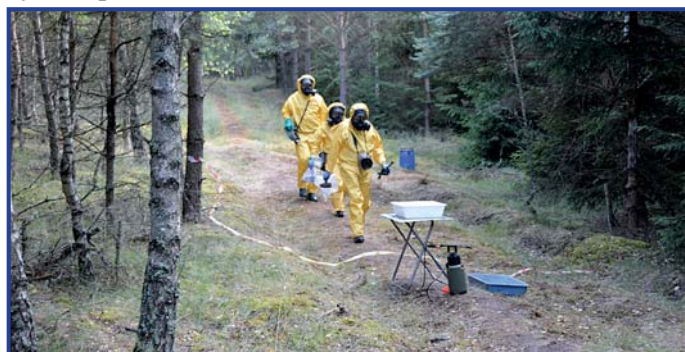
Utylizacja materiałów wybuchowych.

Wniosek o przyznanie dotacji z Narodowego Funduszu Ochrony Środowiska i Gospodarki Wodnej na likwidację pokładów niebezpiecznej nitrocelulozy na terenach byłego „Pronitu” uzyskał pozytywną decyzję zarządu i rady nadzorczej. Przyznana kwota dotacji w wysokości 6 988 800,00 zł łącznie z udziałem własnym miasta Pionki umożliwi szybkie ogłoszenie przetargu i rozpoczęcie prac związanych z usuwaniem i utylizacją niebezpiecznych odpadów na wiosnę br.