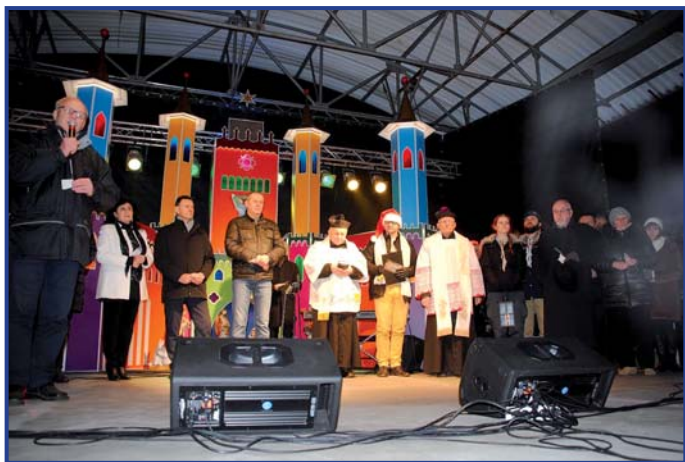
Podczas Wigilii Miejskiej nie mogło zabraknąć życzeń i modlitwy.