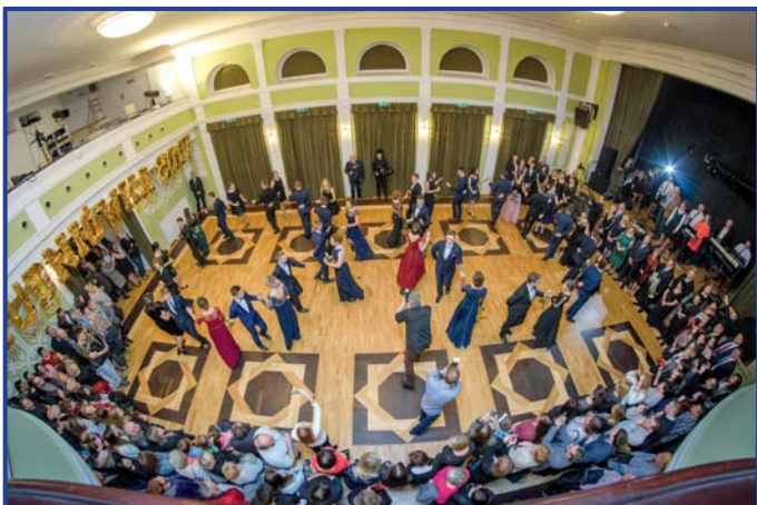
Liceum Ogólnokształcące im. Marii Dąbrowskiej, foto. Wojciech Błażewski.

UCZNIOWIE WSZYSTKICH PIONKOWSKICH SZKÓŁ ŚREDNICH ROZPOCZĘLI ODLICZANIE STU DNI DO MATURY. BAŁE WE WSZYSTKICH SZKOŁACH ROZPOCZĘŁY SIĘ TRADYCYJNYM POLONEZEM, NASTĘPNIE PRZEMÓWIENIAMI I SZAMPAŃSKĄ ZABAWĄ DO ŚWITU.