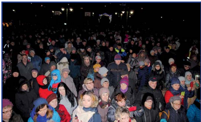
Przybyły setki osób z Pionek i okolic, foto. Roman Fido.

Na scenie głównej ustawiona została okazała, ponad pięciometrowa szopka, wykonana przez pionkowskiego artystę Tomasza Wróblewskiego. Można ją było oglądać do końca stycznia na terenie Ogródka Jordanowskiego.