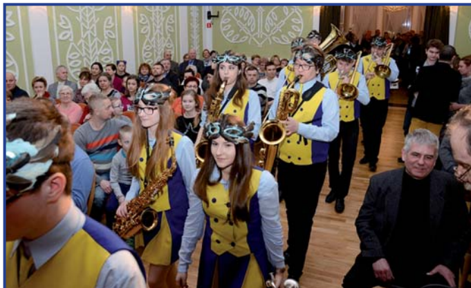
Publiczność była pod ogromnym wrażeniem występów