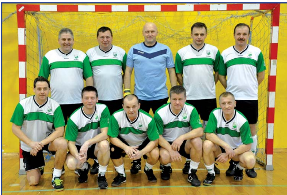
Drużyna Świetliki w Turniej Piłki Halowej