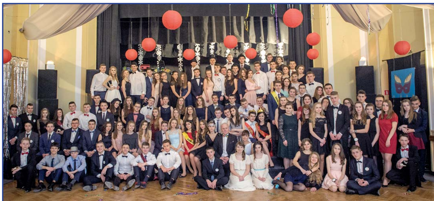
Podczas balu nie mogło zabraknąć pamiątkowego zdjęcia, foto. Wojciech Kuchta.

Młodzież pod wytrawnym okiem wodzireja wspaniale bawiła się do północy.