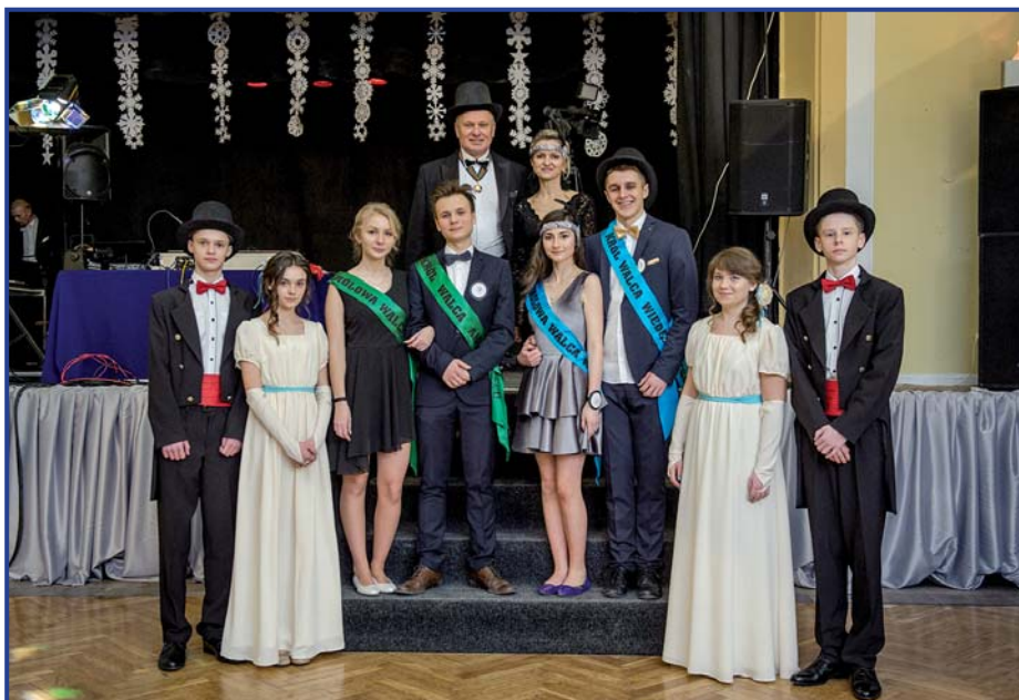
Burmistrz z małżonką osobiście pogratulowali wszystkim Mistrzom Tańców oraz Królowej i Królowi Balu, foto. Wojciech Kuchta.

W trakcie balu odbyły się konkursy na mistrza walca, cha-chy i tanga, a także konkurs na Króla i Królową Balu. Gościem specjalnym była szkoła baletowa z Warszawy