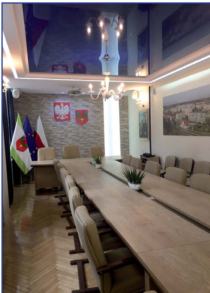
Sala Obrad po remoncie.

Sala obrad to miejsce częstych spotkań przedstawicieli władz miasta. Została dostosowana do prowadzenia obrad z wykorzystaniem multimedialnych.