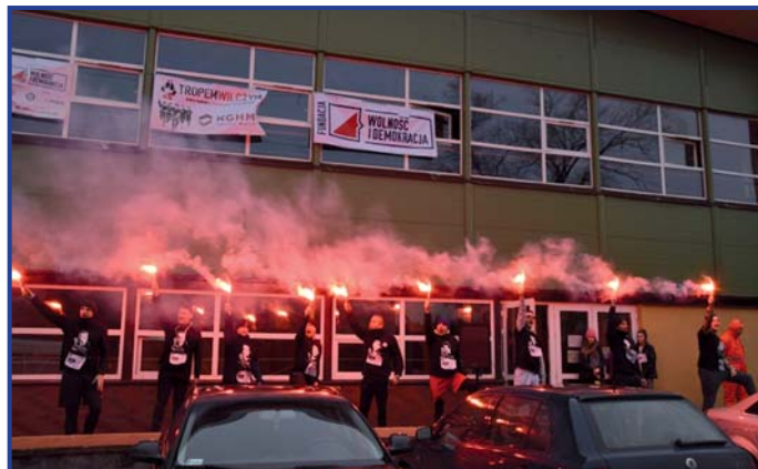
Stowarzyszenie Patriotyczne Pionki w hołdzie poległym bohaterom, foto. Jakub Wojtaszewski, Pionki24.

„Trope Wilczy, bieg pamięci Żołnierzy Wyklętych” w naszym mieście odbył się dzięki wsparciu Urzędu Miasta Pionki (Wydział Sportu i Rekreacji). Współorganizatorami byli Instytut Pamięci Narodowej, Stowarzyszenie Patriotyczne Pionki oraz ZHR.