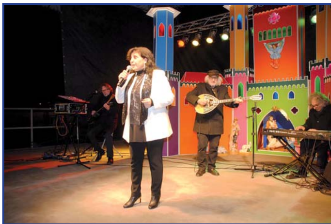
Poruszający koncert Eleni, foto. Roman Fido.