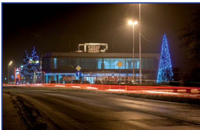
Nowa dekoracja świąteczna

Okres bożonarodzeniowy w mieście uświetniła nowa iluminacja i przepiękne podświetlane choinki, które zostały wykonane sposobem gospodarczym, dzięki czemu w cenie jednej mieliśmy 6 pięknych choinek w różnych częściach miasta.