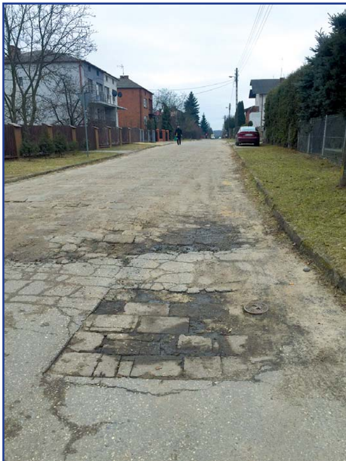
Ulica Reja od lat jest utrapieniem dla kierowców.

dowana zostanie także kanalizacja burzowa, której koszt w całości sfinansuje PWKC.