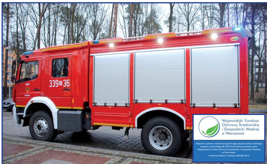
Ochotnicza Straż Pożarna jeździ na akcje już nowym wozem strażackim, foto. Roman Fido.

Dotację w wysokości 189 926,18 zł przekazał Wojewódzki Fundusz Ochrony Środowiska i Gospodarki Wodnej w Warszawie, Urząd Marszałkowski Województwa Mazowieckiego 100 000,00 zł , Komenda Główna Państwowej Straży Pożarnej 250 000,00 zł , Miasto Pionki 241 984,82 zł .