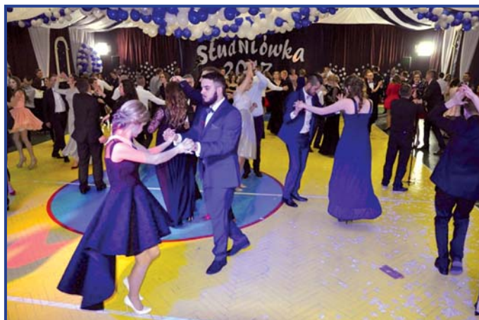
Centrum Kształcenia Zawodowego i Ustawicznego im. Marii Skłodowskiej-Curie, foto. Jakub Wojtaszewski, Pionki24.