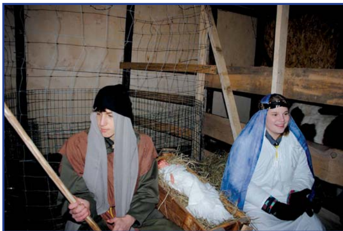
Po raz pierwszy w Pionkach mogliśmy podziwiać żywą szopkę, foto. Roman Fido.