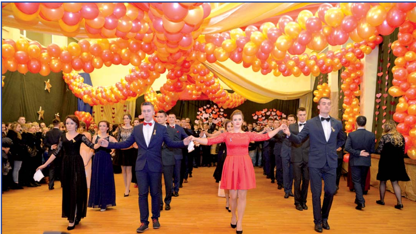
Zespół Szkół im. J. Śniadeckiego, foto. Jakub Wojtaszewski, Pionki24.

STUDNIÓWKA TO COŚ WIĘCEJ NIŻ KLASOWA IMPREZA. TO SYMBOLICZNY KROK W DOROSŁOŚĆ.